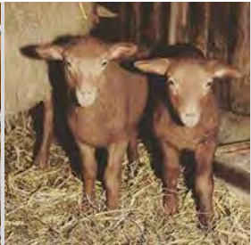
Milch, Butter Käse und Wolle vom Schaf – Erlebnisaufbauernhöfe in der Region