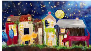
Bilder von Judith Machacek