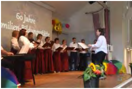
60-Jahr-Feier und „Tag der offenen Tür“